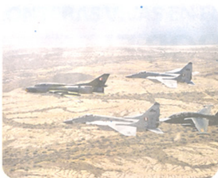
Aeronaves del Comando Operacional Aéreo.

La vigilancia y control de nuestras fronteras es una de las principales tareas en la que se encuentra abocado el Comando Conjunto de las Fuerzas Armadas. Asimismo, en el Frente Interno, el Comando Conjunto trabaja en cuatro escenarios: el primero corresponde a la zona del Valle de los Ríos Apurímac y Ene (VRAE), donde las FF.AA. participan en afianzar la seguridad como parte del plan para las poblaciones del valle denominado una "Opción de Paz y Desarrollo en Se-