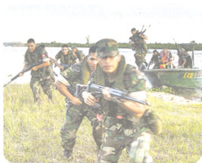
Miembros de las FFAA devuelven seguridad en zonas de emergencia.

guridad", dispuesto por el gobierno. El segundo, al Huallaga, donde elementos de tarea subordinados al Comando Conjunto apoyan a la Policía Nacional del Perú en la lucha contra los remanentes del terrorismo. El tercer escenario corresponde al Alto Putumayo donde se efectúan permanentes patrullajes de control de la frontera para evitar infiltraciones a nuestro territorio. Finalmente, el cuarto escenario se desarrolla en la Costa Norte, donde las operaciones se concentran en el control marítimo y apoyo en el ámbito terrestre para luchar contra las actividades ilícitas.