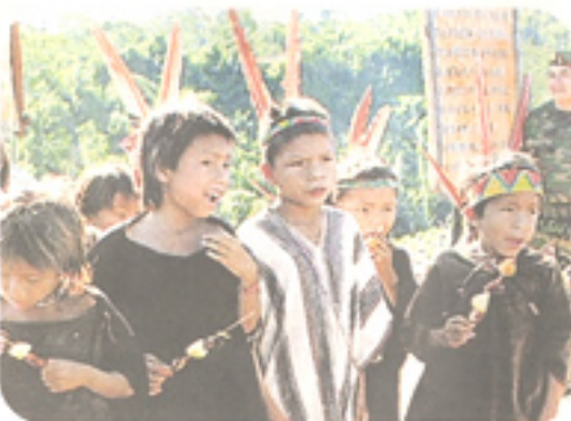
Niños del VRAE con la esperanza de un futuro mejor.

Sin embargo, algunas comunidades del VRAE luchan por un futuro mejor, con gran esfuerzo ante esta situación. Debemos destacar la iniciativa de varias comunidades campesinas que se encuentran en el valle cultivando en biohuertos o dedicándose a la cría de ganados y truchas en piscigranjas. Han creado una alternativa propia para sus familias y su comunidad.