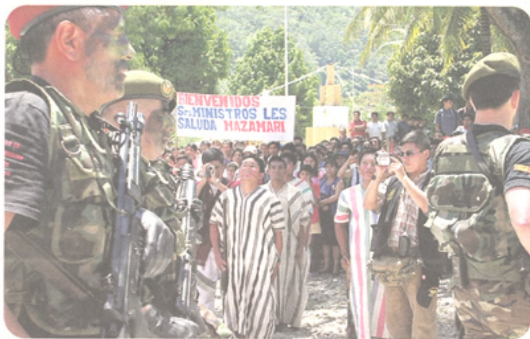
Población del VRAE, beneficiarios de la aplicación de la estrategia de desarrollo integral intersectorial.

Los remanentes de Sendero Luminoso enquistados en la zona de los Valles de los ríos Apurímac y Ene (VRAE), con el fin de financiar sus actos, captan a campesinos para utilizarlos en la cosecha y su consiguiente producción de cocaína. Estos delincuentes terroristas han aprovechado la difícil geografía de la región y las duras condiciones climatológicas para su accionar.