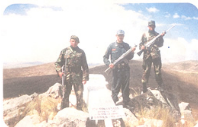
Labor de vigilancia de fronteras, en Puno.

En la actualidad, y con medio siglo de experiencia, contamos con una organización moderna y flexible, estructurada de acuerdo a las necesidades de la Defensa Nacional y la realidad del país, cuya conducción se encuentra a cargo