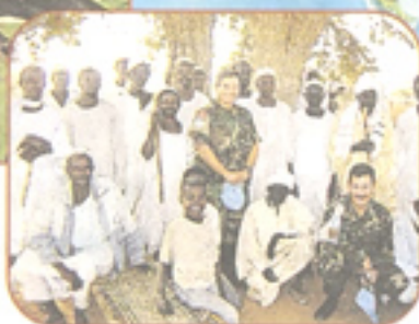
Observadores militares peruanos, presencia de paz en Sudán.